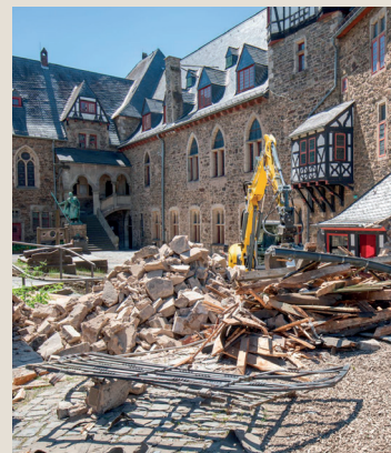
Renovierungsarbeiten im Innenhof

Schloss Burg wird seit 2015 aufwendig saniert. Die Führung bringt die konzeptionellen Grundlagen der Sanierung und deren konkrete bauliche Umsetzung näher. Zudem wird anhand der neuen Dauerausstellung auf die neuen inhaltlichen Schwerpunktsetzungen des Schlosses eingegangen.