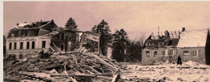
Zerstörte Häuser in der Berliner Straße