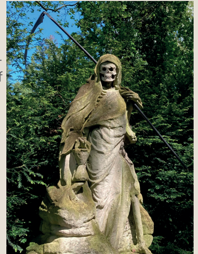
Sensenmann des Melaten-Friedhofs

Möglichkeiten zur Anfahrt auf eigene Kosten : ÖPNV mit der RVK-Linie 260 ab Wermelskirchen Busbahnhof bis Köln Heumarkt, Umstieg in Straßenbahnlinie 1 oder 7 bis Haltestelle „Melaten“, von dort zu Fuß zum Treffpunkt. Alternativ Anfahrt mit dem eigenen PKW.