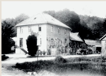
Schöllerhof um 1910

Kosten pro Person: 8,00 € für Mitglieder / 10,00 € für Nichtmitglieder (keine Teilnehmerbegrenzung)