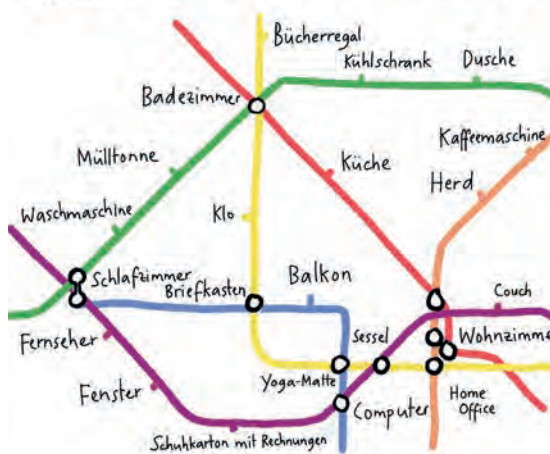
Grafik: Kera Till, www.kerattill.com