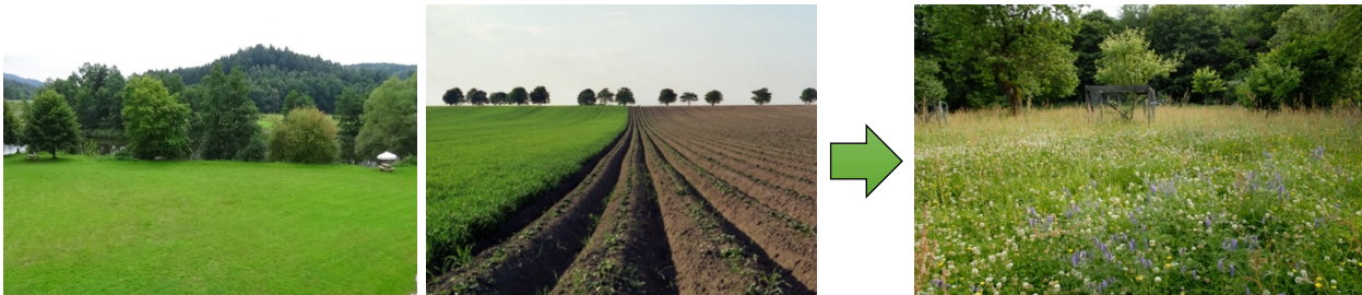
A) Private Zierrasenflächen (oft gemähte artenarme Flächen)