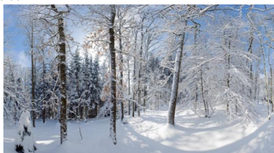
Bergische Winterlandschaft

Termin: So., 15.12.2019, 11.00- 18.30 Uhr Ort: GGS Hoffnungsthal, Hauptstr. 262, 51503 Rösrath Veranstalter: Ortsring Hoffnungsthal e.V.