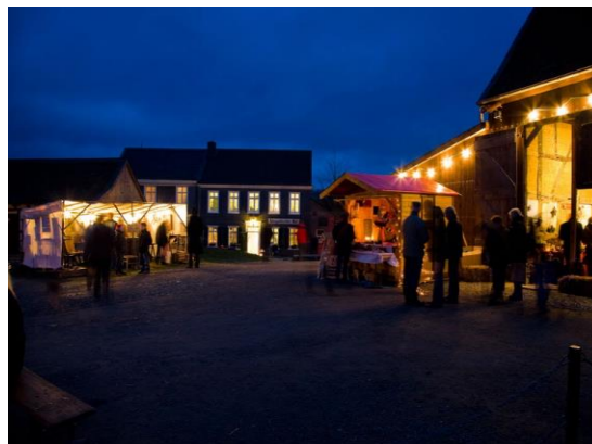
Advent im Museum

Veranstalter: LVR-Freilichtmuseum Lindlar