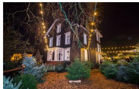
Odenspieler Weihnachtsbäume

Veranstalter: Dissmann Land/ Forst / Garten GmbH & Co. KG