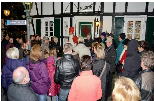
Altstadt Adventskalender

Etwas ganz Besonderes „bescheren“ die Bewohner/innen der Altstadt von Bergneustadt in der Adventszeit.