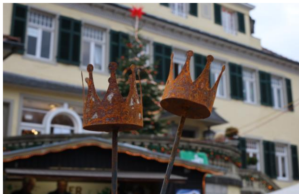
Weihnachtsmarkt Schloss Eulenbroich

Damit auch die Gaumenfreuden nicht zu kurz kommen, wird der Markt durch kulinarische Köstlichkeiten ergänzt, die keine Wünsche offenlassen. Glühwein in verschiedensten Variationen und Kinderpunsch dürfen auf dem Schlosshof vor traumhafter Kulisse genauso wenig fehlen wie Waffeln, Crêpes, Wildbratwurst und Flammkuchen. Das Rösrather Unternehmen Hoffer Alter empfängt die Gäste mit einer Verköstigung verschiedener Liköre.