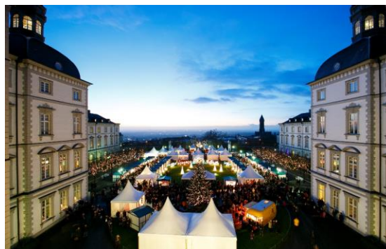
Schloss Bensberg

Termin: Fr., 13.12.2019, 16.00- 21.00 Uhr Sa., 14.12.2019, 13.00- 21.00 Uhr So., 15.12.2019, 11.00- 20.00 Uhr Ort: Grandhotel Schloss Bensberg, Kadettenstraße, 51429 Bergisch Gladbach Veranstalter: Grandhotel Schloss Bensberg