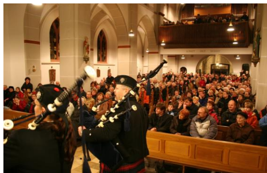
Nutscheid Forest Pipe Band mit einem Konzert in St. Severin

Die Döörper Weihnacht in Ruppichteroth ist zum Synonym für Romantik, vorweihnachtliche Adventszeit und für festliche Atmosphäre zwischen den beiden Kirchen im Ortskern geworden. Kein anderer Weihnachtsmarkt in unserer Region kann diese besondere Stimmung vermitteln, die viele Tausende Besucher Jahr für Jahr anzieht, um ein ganz besonderes Adventswochenende zu feiern. Seit nun 25 Jahren zählt die Döörper Weihnacht am zweiten Adventswochenende zu den Höhepunkten der Vorweihnachtszeit im Rhein-Sieg-Kreis. Von Jahr zu Jahr wurde die „Döörper Weihnacht“ größer und schöner.