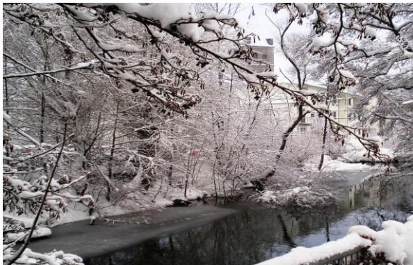
Wupper im Winter, Hintergrund St. Nikolaus

In der ältesten Stadt des Bergischen Landes findet am Freitag und Samstag des ersten Adventswochenendes (29./30.11.) der alternative Adventsmarkt statt. Traditionell gibt es hier viele Dinge zu entdecken, die in liebevoller Handarbeit und oft von Vereinen, Schulen und Initiativen in Wipperfürth selbst hergestellt wurden. Für das leibliche Wohl ist gesorgt: Genießen Sie frisch gebrannte Mandeln, Reibekuchen, Gebäck, Glühwein, Feuerzangenbowle, Punsch und vieles Mehr. Der Adventsmarkt in der Hansestadt Wipperfürth wird von der evangelischen und katholischen Kirchengemeinde organisiert und findet auf dem Hausmannsplatz, rund um die Pfarrkirche St. Nikolaus statt. Parkplätze stehen in ausreichender Zahl u.a. auf den Parkplätzen „Ohler Wiesen“ und „Wupperstraße“ zur Verfügung.