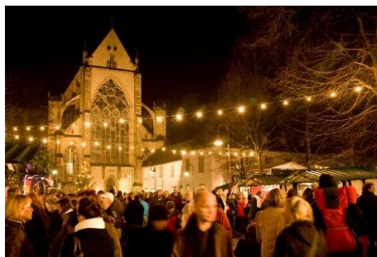
Altenberger Adventsmarkt

Vom 6. bis 8. Dezember lädt der Verschönerungs- und Kulturverein Altenberg auch in diesem Jahr zu einem Besuch auf dem Altenberger Adventsmarkt ein. Der Duft von Glühwein und Lebkuchen, weihnachtlich dekorierte Buden und eine festliche Atmosphäre empfangen den Gast beim Besuch des diesjährigen Altenberger Adventsmarktes, der romantisch im Schatten des Altenberger Domes und des Haus Altenbergs liegt. Auf der Bühne finden musikalische Darbietungen statt und der Nikolaus sorgt mit seinem Besuch auf dem Markt für Überraschungen bei den Kleinen. Auch in diesem Jahr gibt es wieder eine Tombola mit attraktiven Preisen.