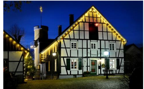
Heimatmuseum in Bergneustadt

Termin: Fr., 29.11.2019, 18.00- 22.00 Uhr Sa., 30.11.2019, 15.00- 22.00 Uhr So., 01.12.2019, 11.00- 18.00 Uhr Ort: Am Heimatmuseum in der Historischen Altstadt, Wallstraße 1, 51702 Bergneustadt Veranstalter: Heimatverein „Feste Neustadt“ e.V., Bergneustädter Vereine und Schulen