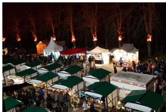
Christkindmarkt Engelskirchen

Auch in diesem Jahr öffnet der Christkindmarkt seine Pforten. Besucher können sich nicht nur auf weihnachtlich dekorierte Hütten und Stände freuen, sondern auch auf eine fröhliche und weihnachtliche Atmosphäre. Auf dem Christkindmarkt entdeckt man hochwertiges Kunsthandwerk, ausgefallene Geschenke und kulinarische Genüsse. Außerdem gibt es ein Bühnenprogramm. Im Ort ist verkaufsoffener Sonntag.