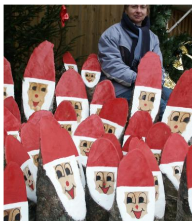
Nikoläuse aus Holz

Das musikalische Programm, die vielfältigen Angebote an Speisen und Getränken sowie die Warenauslagen alles wurde vielfältiger und attraktiver; speziell durch die besondere weihnachtliche Stimmung, die die mehr als 80 liebevoll geschmückten Holzhäuschen vermitteln. Die Marktmeile ist bestückt mit 300 kleinen Fichten und 100 Strohballen, man bewegt sich in einem heimeligen Weihnachtswald. Die weihnachtliche Atmosphäre stellt sich auch deshalb ein, weil für alle Aussteller die verbindliche Voraussetzung gilt: keine Pavillons oder Zelte aus Plastik, keine Marktbuden- wer teilnehmen will, muss ein Holzhäuschen vorweisen können. Der Eintritt ist frei. Parkmöglichkeiten bieten sich an der Grund- und Sekundarschule oder an der Bröltalhalle und auf weiteren ausgewiesenen Parkplatzflächen.