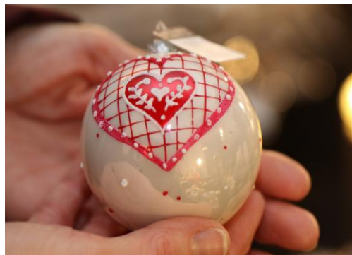
Weihnachtsmarkt Schloss Eulenbroich