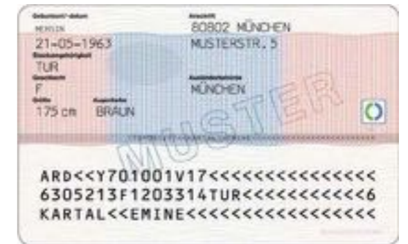
Abbildung exemplarisch für alle nachfolgenden Aufenthaltstitel