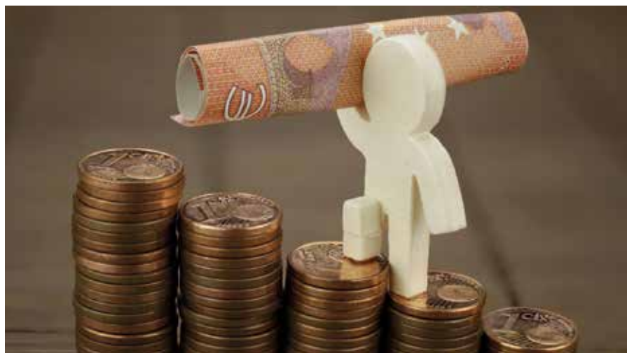
Das neue Aufstiegs-BAföG: Förderung für die berufliche Karriere